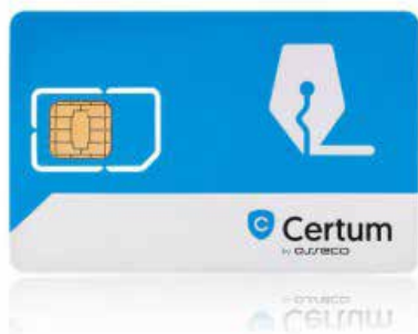
Zestaw cryptoCertum MINI bez czytnika

Karta Certum jest wymieniona na stronie www.cepik.gov.pl jako spełniająca wymagania techniczne.